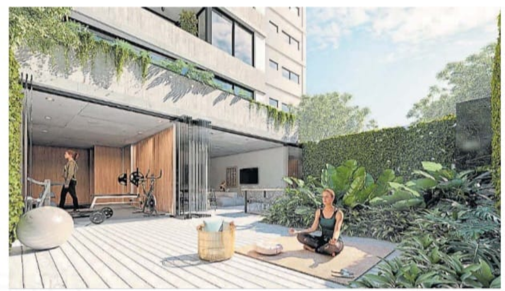
Para el relax. Los espacios del edificio Quality Buildings Senillosa, de la desarrolladora Grupo 8.66.

En tanto, a los kids rooms ahora se suman los teens rooms, dirigidos a los adolescentes. "Incluir es-